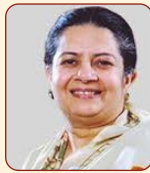
Padmabhusan Smt. Rajashri Birla, Mumbai