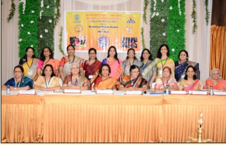
वनबंधु परिषद, राष्ट्रीय महिला समिति, नई गवर्निंग बॉडी की नियुक्ति